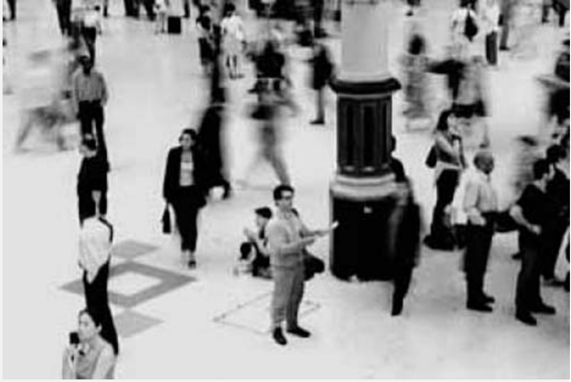
Şekil 3 Kalabalıkta bir yabancı.