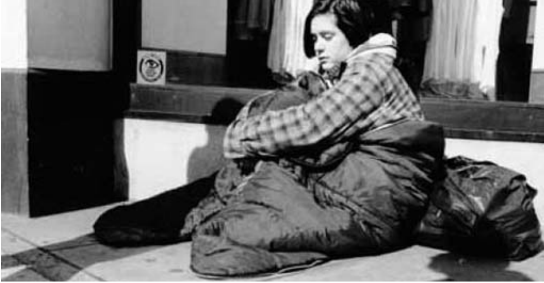
Şekil 1: Ünite içeriğini takip.

sadece sosyal dünyayı nasıl çalıştıığımızla ilgili yeni seçenekler yaratmakla kalmaz, aynı zamanda bize insanlığa dair daha geniş bir bilgi ve tecrübe birikiminden yararlanma fırsatı da sunar. Şekil 1 bu dersin üç ana temasını göstermektedir.