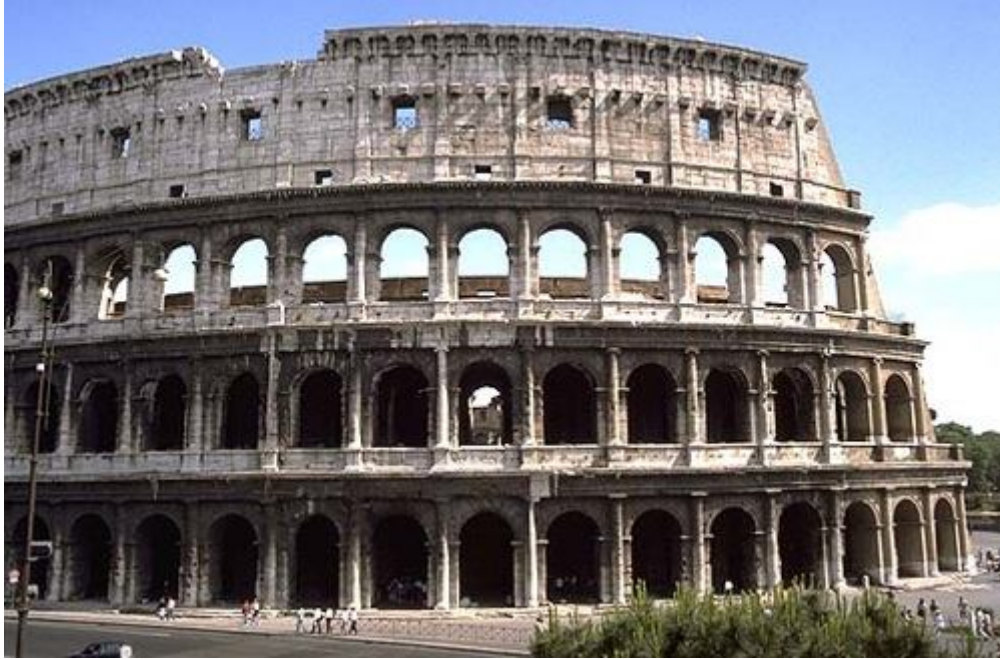
Foto: R. Scaife. Resim VROMA projesinin izniyle http://www.vroma.org