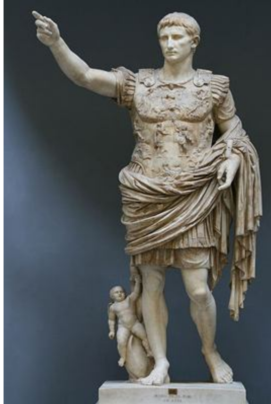
Augustus'un Prima Porta Heykeli