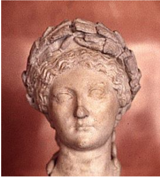
Livia, Augustus'un Eşi