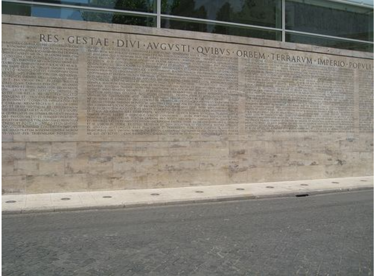
Modern posting in Roma'da Augustus'un Res Gestae'sinin modern kopyası. Foto: Seth Schoen , 2008. Bazı hakları saklıdır.