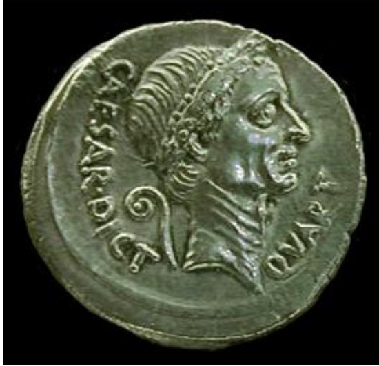
Foto: Barbara McManus, Resim VROMA projesinin izniyle at http://www.vroma.org