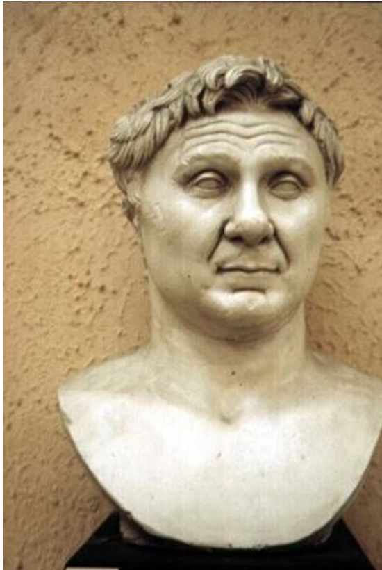
Foto: Jeremy Walker, Resim VROMA projesinin izniyle http://www.vroma.org